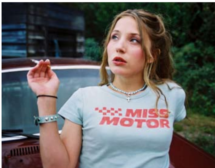
Tuva Novotny i Ulf Malmros tidigare film Smala Sussie.